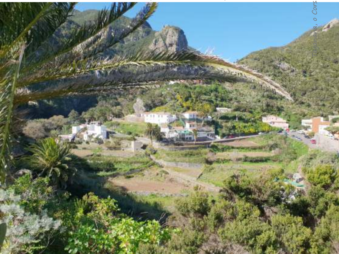
Chamorga, o Corsica mascată