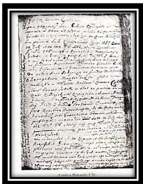
Însemnare din Condica Hațegului

În anul 1669 opidul fiscal Hațeg era învestit cu magistratură autonomă, supusă numai guvernului transilvan și cu dreptul de a alege doi deputați în dietă. Ulterior orașul a avut dreptul la un singur reprezentant în dietă, pentru ca în anul 1875, să piardă acest drept. Magistratura din Hațeg avea două atribuții: una judecătorească și alta administrativă. Atribuțiile judecătorești i-au fost luate în anul 1872, rămânând doar cele administrative, care, cu unele modificări printre care subordonarea față de comitat, își păstra dreptul de a numi căpitanul poliției. 371