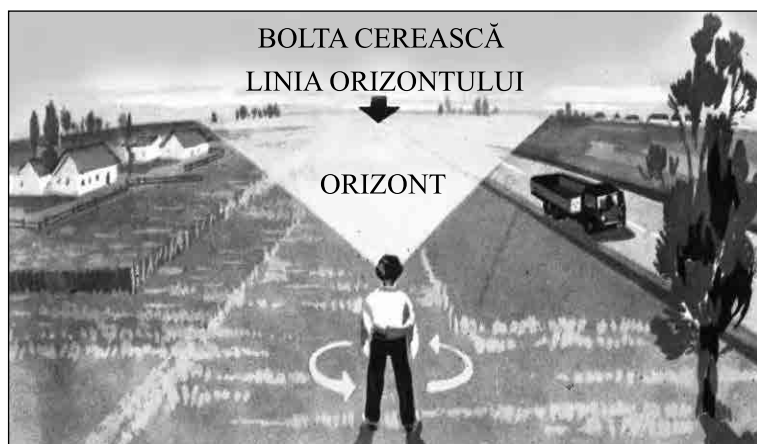
Fig. 1. Orizontul și linia orizontului

Dacă privim pe fereastra camerei, în depărtare, lucrurile pe care le vedem devin tot mai neclare și avem impresia că pământul se unește cu cerul.