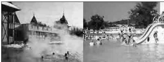
Fig. 124. Băile Felix

7. Cu ce formă de relief se prelungeste Lunca Dunării la vărsarea Dunării în Marea Neagră?