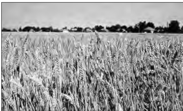
Fig. 4. Orizont „deschis”

5. Priviți figura 1. Arătați orizontul și linia orizontului. Spuneți ce vede elevul până la linia orizontului. Cum va apărea orizontul dacă elevul se va răsuci la dreapta și la stânga?