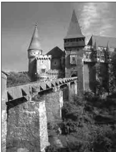
Fig. 2. Orizont apropiat

Locurile aflate la distanță mai mare de noi, în care obiectele și ființele nu se mai disting clar, formează orizontul îndepărtat .