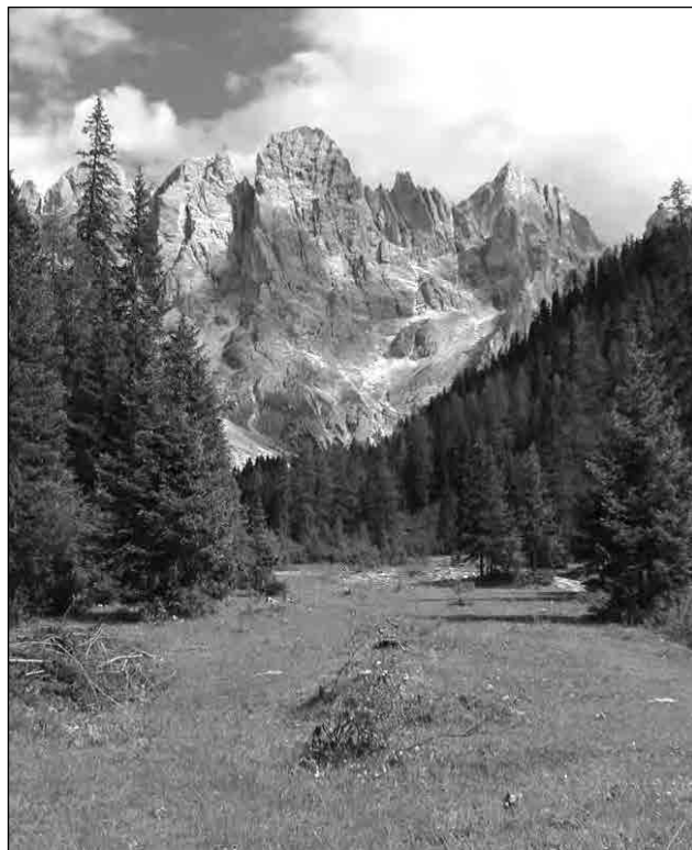
Fig. 5. Orizont „închis”