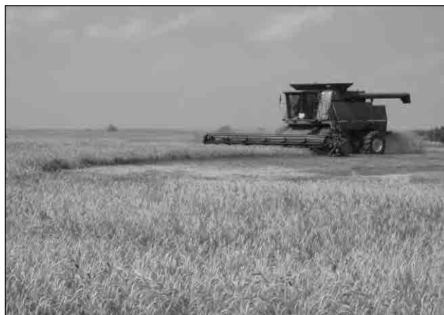
Fig. 125. Câmpia Bărăganului