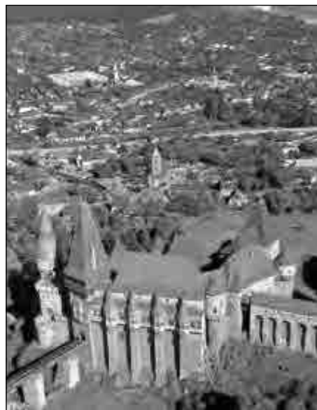
Fig. 3. Orizont local