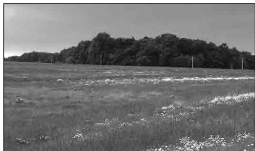
Fig. 122. Lunca Dunării

Câmpia Română este așezată în partea de sud a țării, de-a lungul Dunării, fiind numită și Câmpia Dunării. Cele mai mari înălțimi, de 200-300 m, apar în partea nordică, iar cele mai mici în partea de est (sub 100 m). Partea de vest a Câmpiei Române se numește Câmpia Olteniei, iar partea de est Câmpia Bărăganului, numită și „grâнарul țării”. Câmpia Bărăganului are un climat secetos vara și geros iarna, datorită Crivățului.